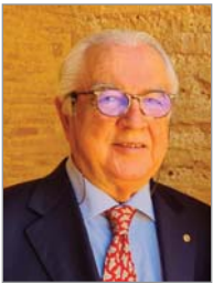
Dimas Rizzo Gobernador del Distrito 2203